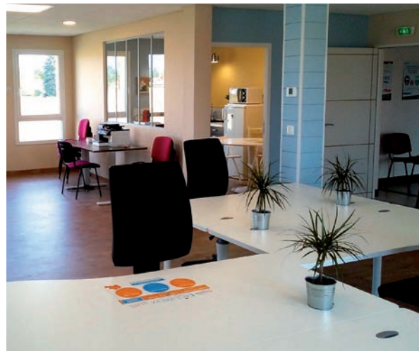
Le Coworking, une solution souple pour les travailleurs indépendants.

Une salle de réunion, un bureau éphémère et 8 bureaux en open space sont proposés avec différents services accessibles.