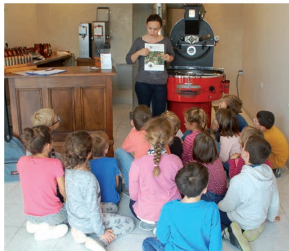
Découverte de la torréfaction, à Perrex.

Un projet similaire est développé à Grièges.