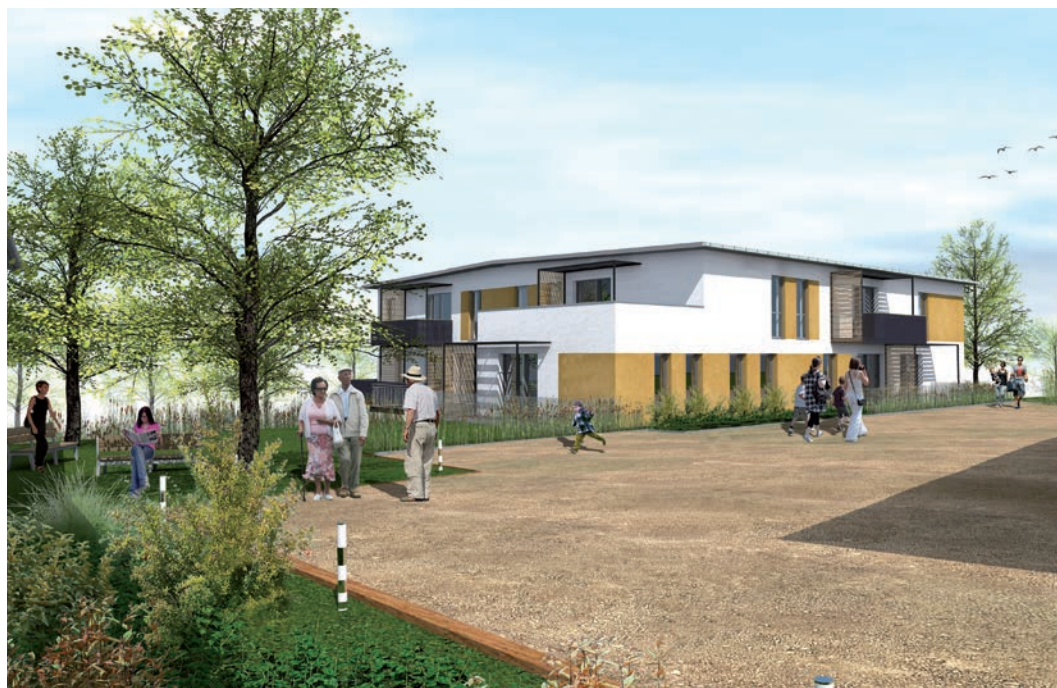
La Tisanerie, un projet de 6 logements adaptés à Chaveyriat.

Après Laiz dont les logements ont ouvert en avril, la Communauté de communes s'engage dans 2 nouveaux projets de logements adaptés pour personnes âgées.