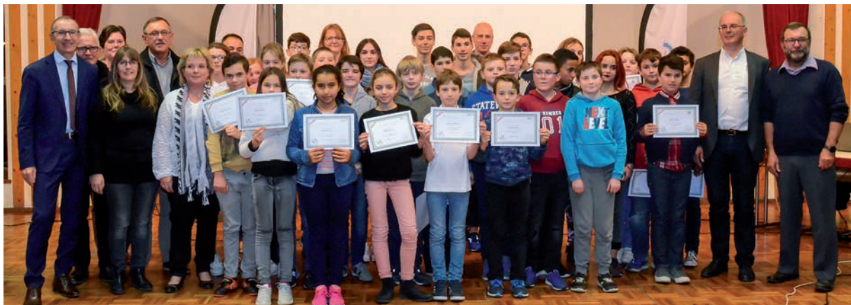
Les 21 nouveaux élus du CIJ, salués pour leur engagement citoyen lors de leur installation, à Mézériat.

Retrouvez la liste des 36 jeunes élus sur notre site : www.cc-laveyle.fr