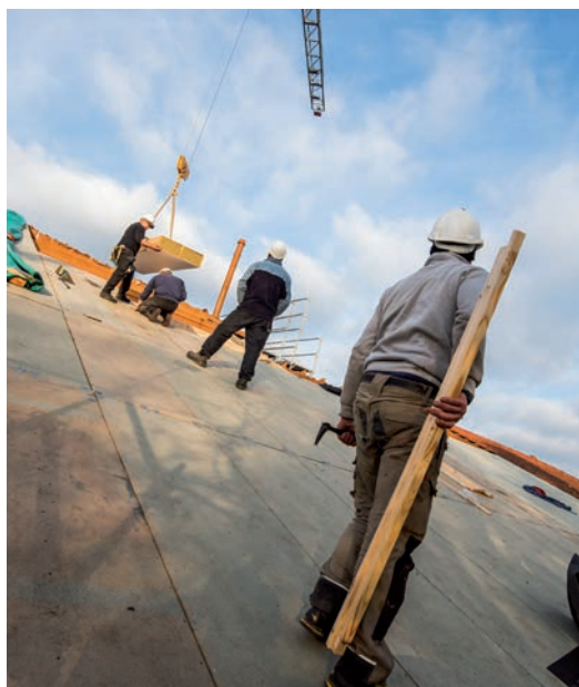
Représentant 18% de l'investissement global, au niveau national, l'investissement public est créateur d'emplois.