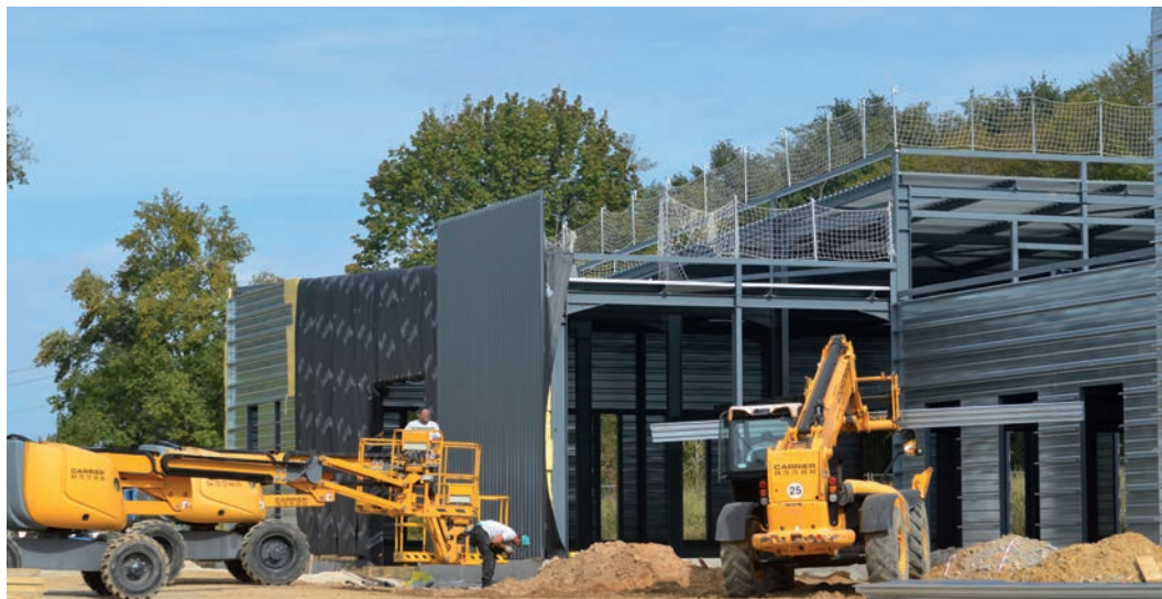
41% du PPI seront consacrés au développement économique et à l'aménagement du territoire.