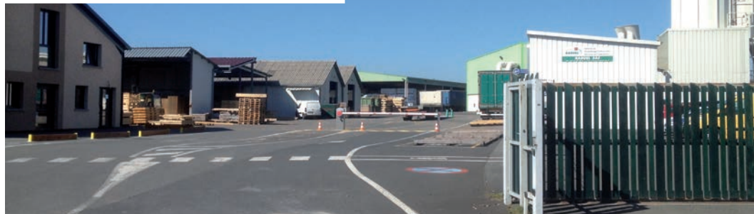
Sur son site de Cormoranche, Rabuel SA emploie 65 personnes en CDI et 15 ETP en intérim.