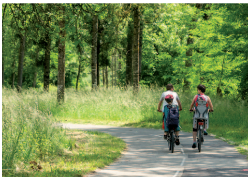
L'aménagement d'une voie cyclable en bord de Veyle est à l'étude.

Ces investissements correspondent à des besoins clairement identifiés qui concernent autant les habitants - c'est le cas des travaux à mener sur les équipements communautaires par