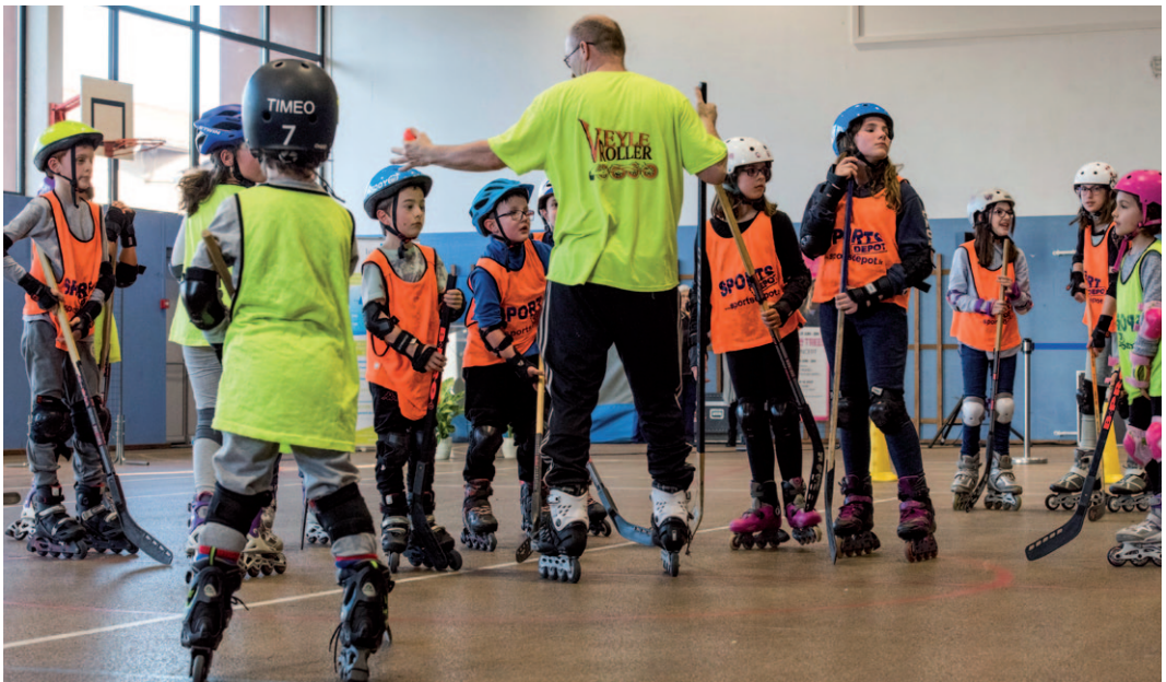
L'association Veyle Roller en démonstration lors de la soirée de réouverture du gymnase de Pont-de-Veyle.

Avec un budget dédié de 227 000€, la Communauté de communes est le premier partenaire des associations sportives et culturelles du territoire.