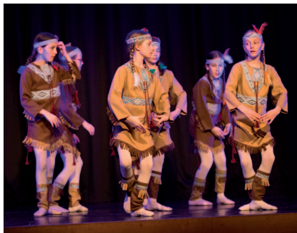
Les jeunes de l'école de musique de Vonnas, lors d'un spectacle sur «le Rêve américain» en mars 2018.

sociaux du territoire, c'est l'immatériel et l'humain. La présence des élus lors des événements ou des assemblées générales par exemple. Le soutien des services dans les échanges du quotidien. Le forum des associations évidemment, début septembre, au cours duquel les associations peuvent échanger entre elles et rencontrer les habitants. Et des outils « virtuels » qui permettent aux associations de gagner en visibilité et en efficacité : l'annuaire des associations affiché sur le site internet de la Communauté de communes, la newsletter « sorties du week-end » préparée et diffusée par l'Office de tourisme, les réseaux sociaux communautaires, etc.