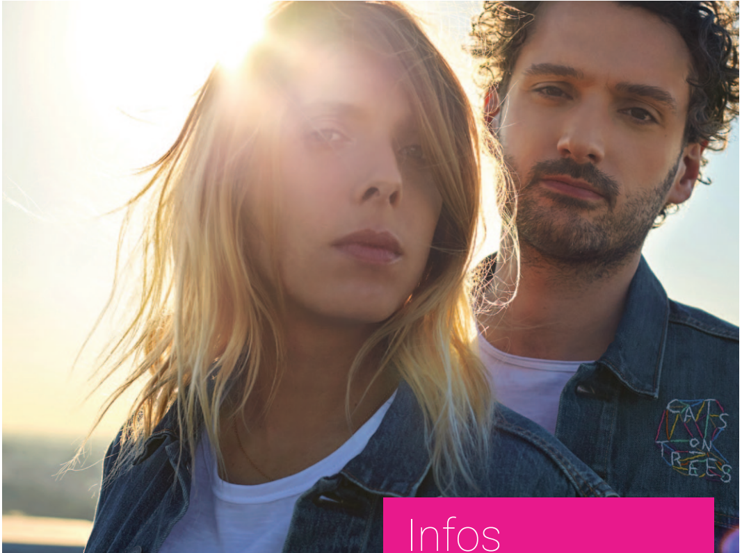
Cats On Trees ouvrira la première édition de Festi'Veyle, au Domaine des Planons, le 29 juin.

Le groupe Cats On Trees ouvrira le nouvel événement culturel organisé par la Communauté de communes, Festi'Veyle. Rendez-vous les 29, 30 juin et 1 er juillet au Domaine des Planons.